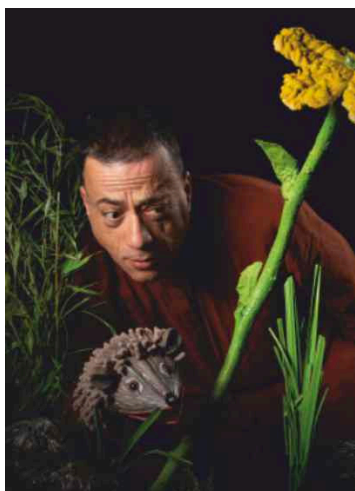
Lagoa Pequena (Estação das Letras)