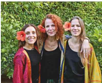
Uma Volta ao Mundo (Mundos da Música)